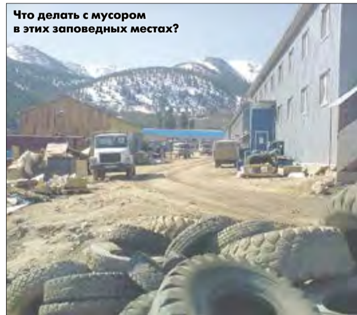
Что делать с мусором в этих заповедных местах?