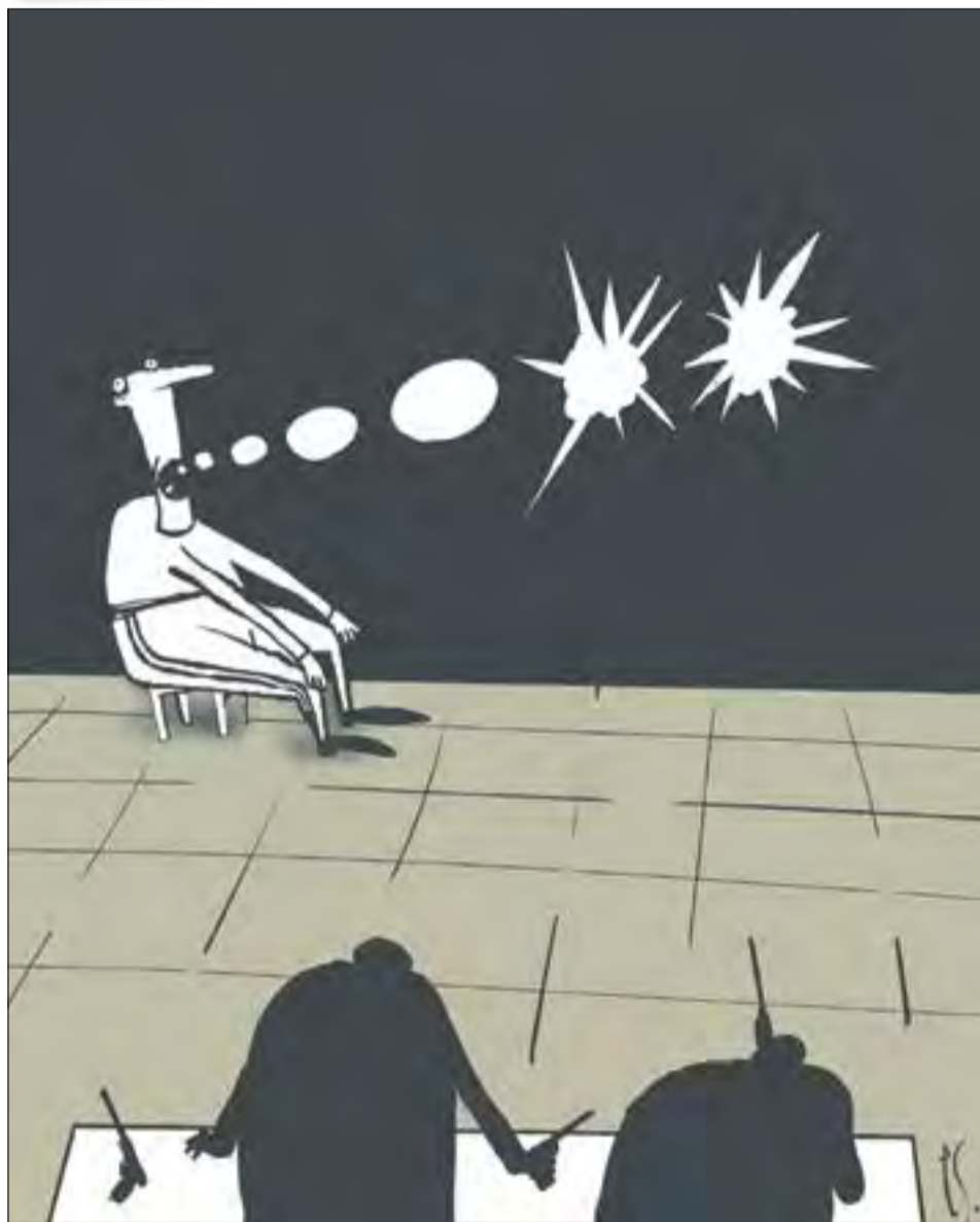
Петр САРУХАНОВ — «Новая»

Виват, КС! С угрюмым стоном в тебя вонзятся сотни жал, но ты стране послужишь фоном, чтоб всяк себя зауважал