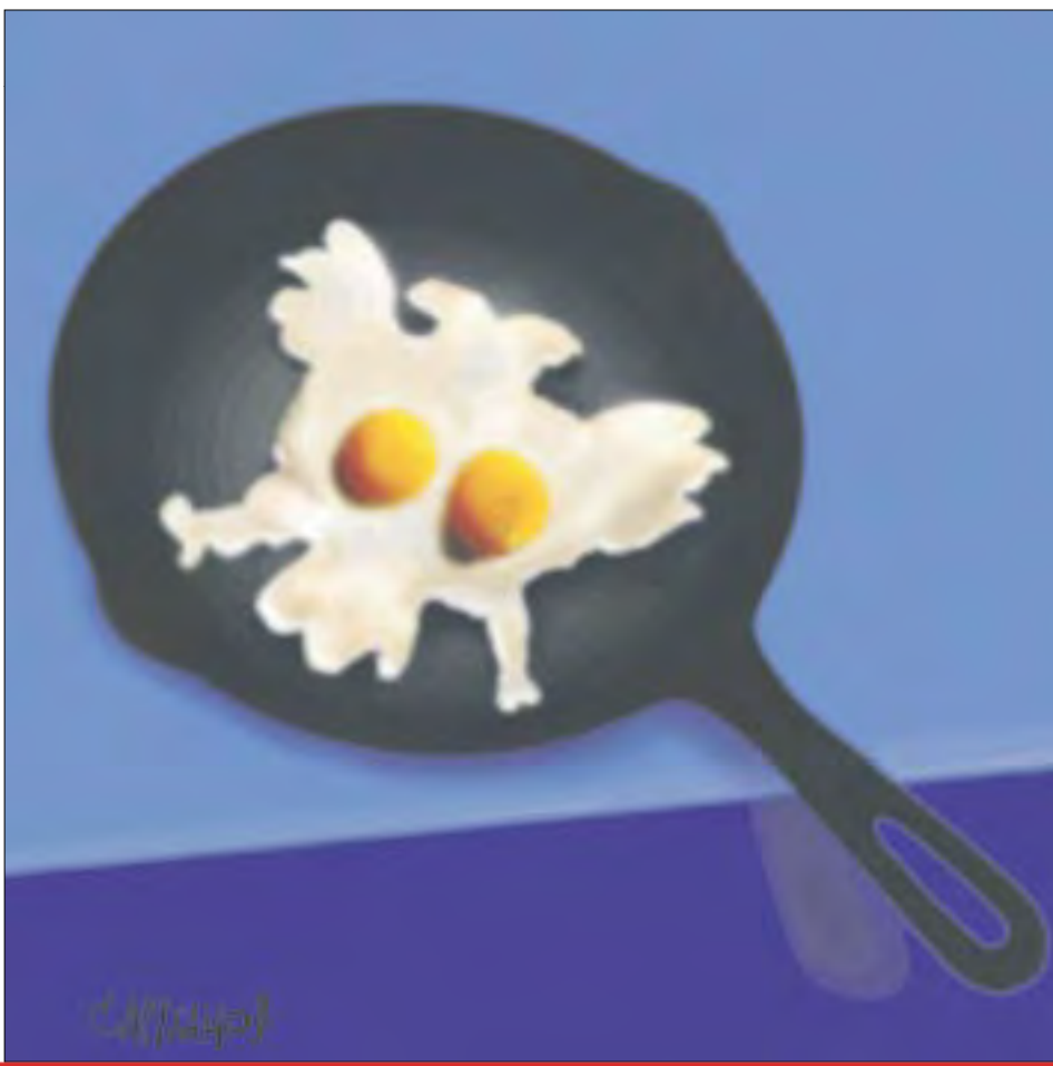
Петр САРУХАНОВ — «Новая»