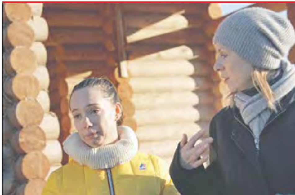
Чулпан Хаматова и Дина Корзун — основатели фонда «Подари жизнь»

В Москве, благодаря правительству города, появится детский хоспис, а во Владимирской области достраивают первый в России реабилитационный центр для детей, победивших рак