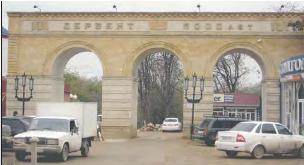
Надпись на арке у городского парка сообщает, что Дербенту уже пять тысяч лет. Путин уверен, что только две

Дербент не может оправиться от последствий ливня и селевых потоков. Сотни людей до сих пор остро нуждаются в помощи, скоро зима. Прибывшие добровольцы пытаются помочь пострадавшим, дагестанские чиновники сопротивляются