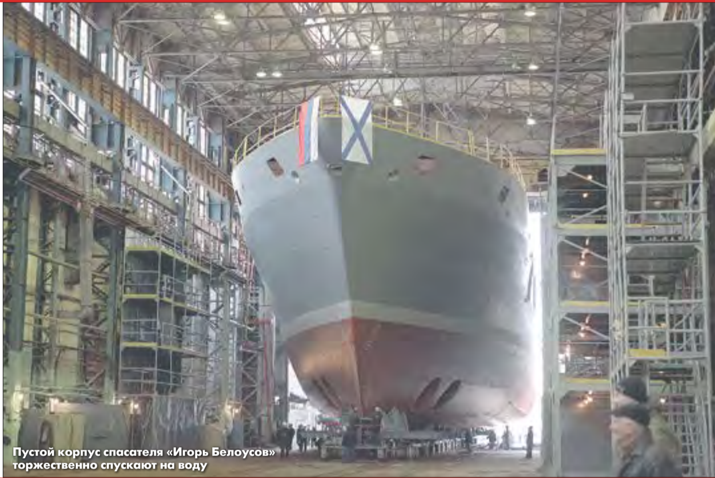
Пустой корпус спасателя «Игорь Белоусов» торжественно спускают на воду