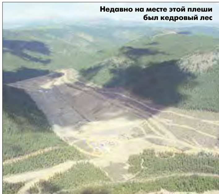
Недавно на месте этой плещи был кедровый лес

Однако не отделаться от впечатления, что читаешь отчеты из 50-х, а то и 30-х годов прошлого века. Расходов по экологическим статьям — кот наплакал. Сказано, что на полигоне твердых бытовых отходов закончены работы по укладке геоткани и геомембраны. И всё.