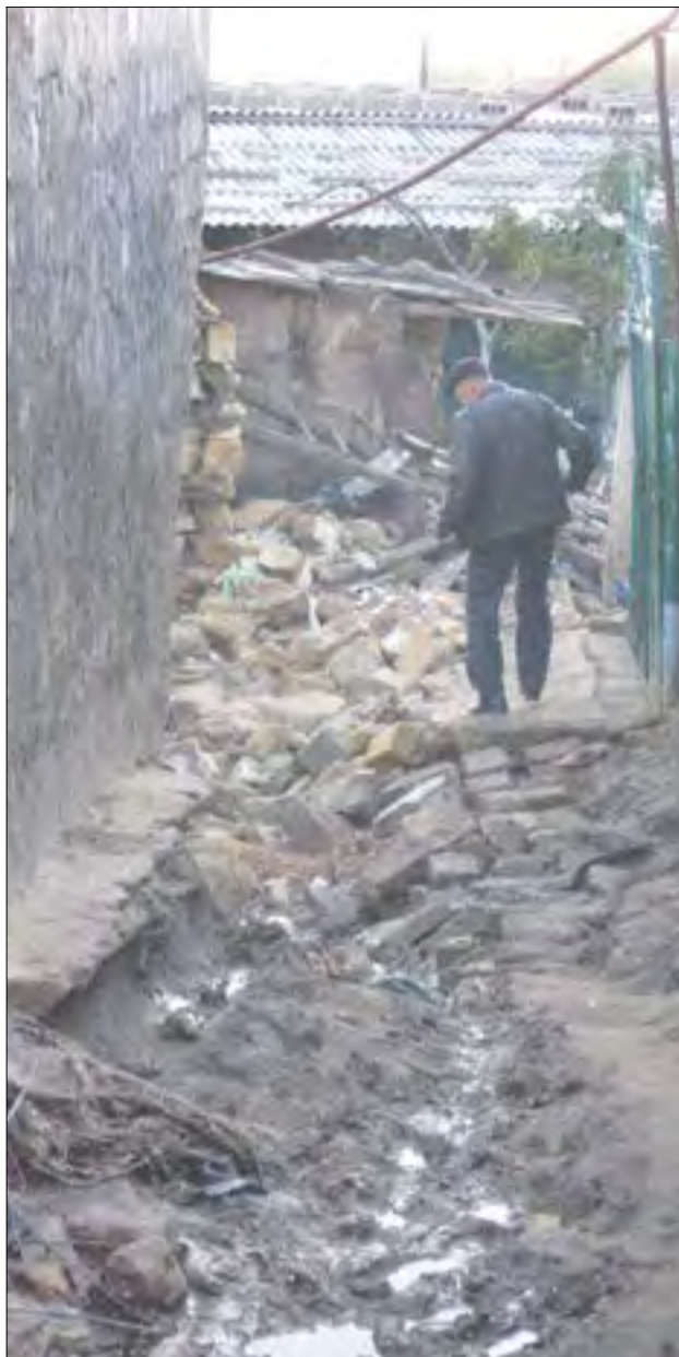
Так выглядят дороги поселка Сабнава спустя шесть недель